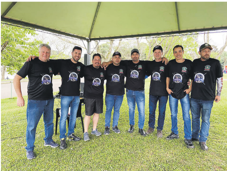
Na foto, os organizadores da 1ª edição da Festa do Peixe