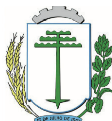
Prefeitura Municipal de Irati