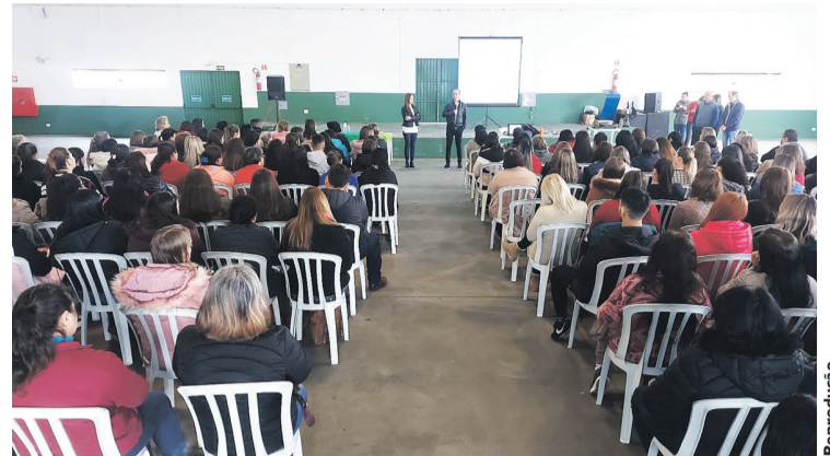
O curso visa preparar os servidores para casos de urgência

O curso almeja aumentar a segurança dos alunos no ambiente escolar