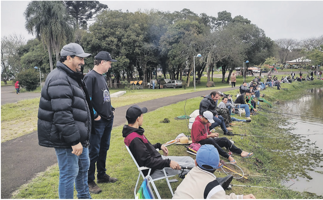
O evento contou com mais de 800 inscritos e duas toneladas de alimentos arrecadados

A 1ª Festa do Peixe de Imbituva, que aconteceu no Parque Aquático, dia 11 de setembro, foi um sucesso. A festividade foi uma parceria entre Prefeitura, Secretaria do Meio Ambiente, Secretaria de Agricultura e Secretaria de Indústria e Comércio. O evento contou com mais de 800 inscritos e duas toneladas de alimentos arrecadados com as doações dos participantes, que serão destinados para as instituições do município.