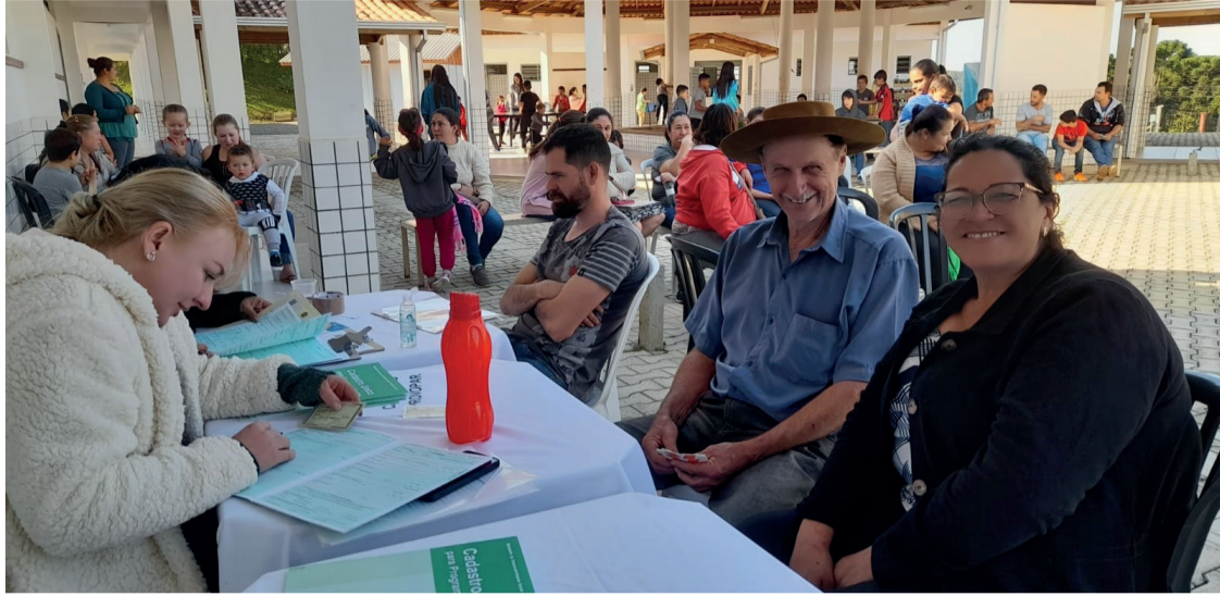
As ações foram realizadas durante o mês de agosto e atendeu pessoas da área rural

As ações foram realizadas pela Secretaria de Assistência Social com apoio da Prefeitura Municipal