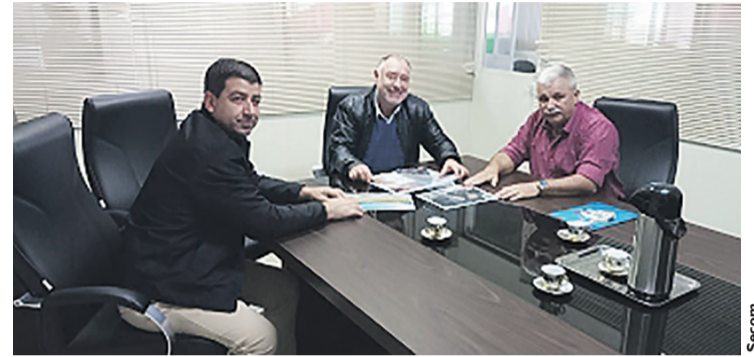
O primeiro contato entre a administração e empresa foi na Expolrati

Empresa catarinense busca área para se instalar em Irati