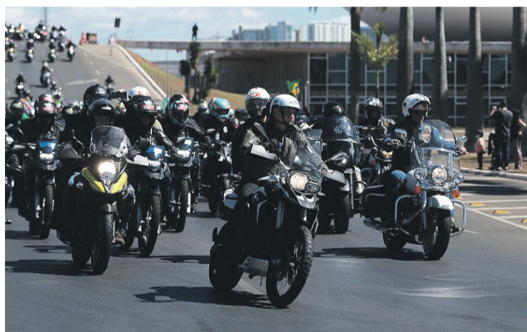
Atual presidente fará uma motociata na região, saindo de Guamiranga