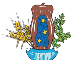
Prefeitura Municipal de Prudentópolis