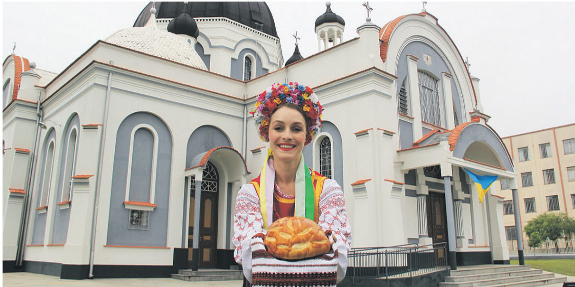
Jair Bolsonaro (PL) visitará a igreja São Josafat em Prudentópolis, onde fará um comício

Presidente também fará uma motociata, saindo de Guamiranga, e um comício