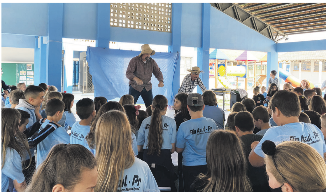
Professores criadores de “Os Cumpadi” unem diversão e aprendizado no projeto Riso e Movimento

“Tem que dar risada e se movimentar. As crianças gostam, pulam, fazem exercícios que é bom. Esse momento é para isso, também fazemos de