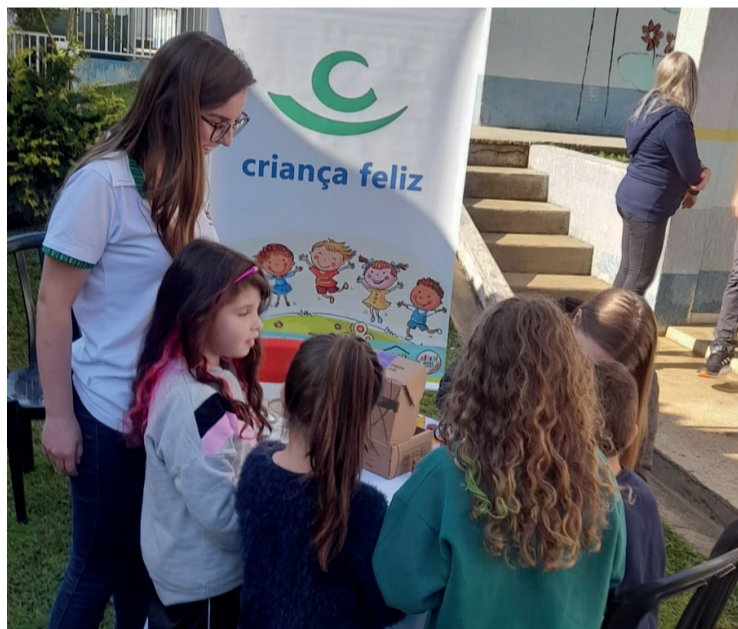
As crianças participaram do projeto Criança Feliz e do ônibus temático

Além dos projetos e cadastros realizados, os profissionais fizeram debates onde esclareceram e informaram sobre os direitos da população, como acontecem os atendimentos e orientações em geral. “Essas ações foram muito importantes para facilitar o acesso da população rural de Fernandes Pinheiro às instituições da Secretaria da Assistência Social, proporcionando proximidade das comunidades e os profissionais para realizarem escutas, orientações, encaminhamentos, entre outros”, conclui a secretária de Assistência Social.