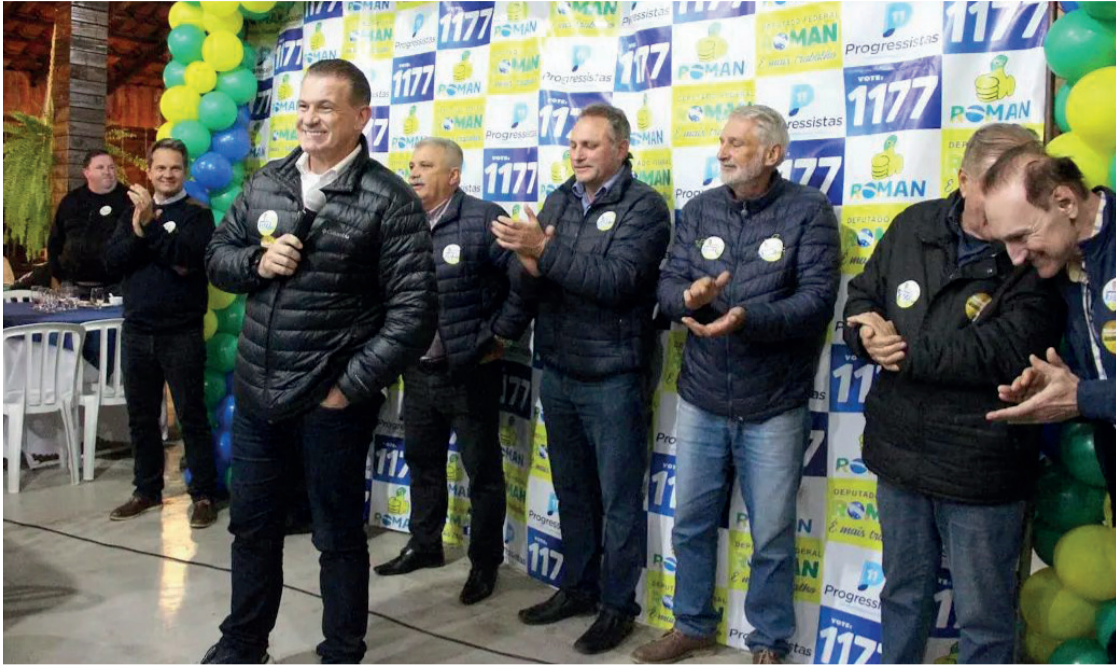
Deputado destacou o comprometimento com a população durante lançamento da campanha

Candidato a deputado federal comenta sobre as propostas para o cargo, em dar continuidade ao trabalho que já realiza