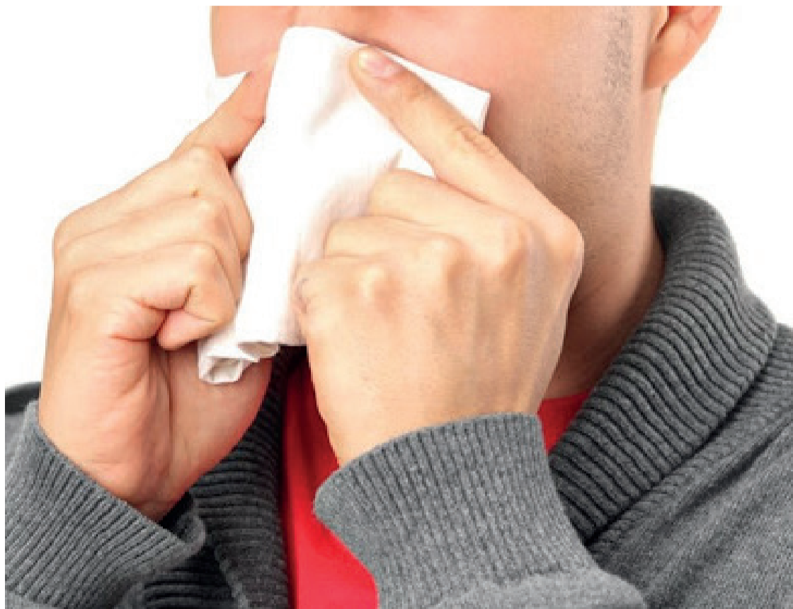
Os sintomas da fístula liquórica são coriza clara, hialina, tosse, espirro e mudança de posição da cabeça

Podem ser de origem traumática, como acidentes com traumatismo cranioencefálico; iatrogênica, após cirurgia nasossinusal ou de base de crânio; podem ser por problemas congênitos como meningoencefalocelos nasais; e podem ser idiopáticas, sem causas aparente, tendo o diagnóstico de hipertensão intracraniana idiopática como principal diagnóstico diferencial; tumores nasossinuais ou cerebrais podem se manifestar inicialmente como fístula rinoliquórica.