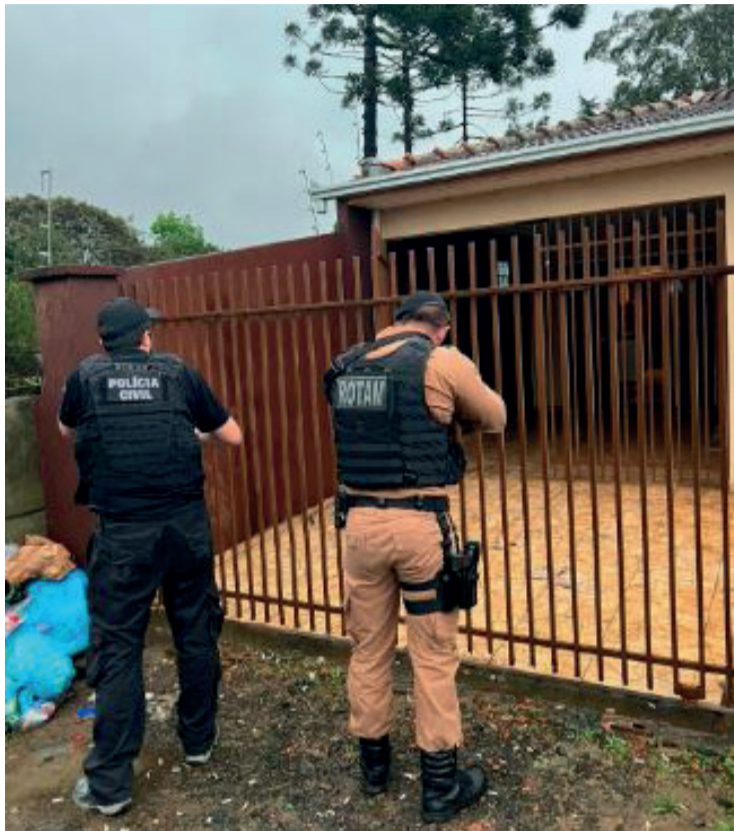
Um rapaz foi detido, no momento em que saía da residência

Após levantamento da equipe policial, foi possível encontrar os paradeiros dos alvos. No final da tarde de quarta-feira (14), o primeiro alvo, um rapaz de 28 anos, foi detido em